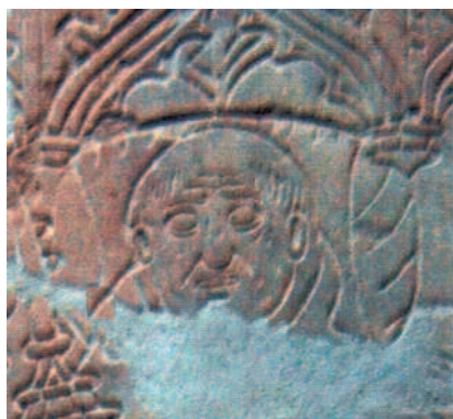
Dalle funéraire dans la salle capitulaire de Montheron, «abbé»