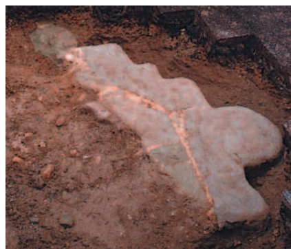
base du pilier sud-est de la 2 e travée de la nef

Association des Amis de l'Abbaye de Montheron p/a Daniel Thomas ch. de Beaumont 8 – 1053 Cugy tél: 021 731 25 39 – aaam@carillonneur.ch www.carillonneur.ch