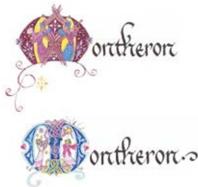
Illustration : le nom de Montheron en calligraphie par Jane Sullivan.

Renseignements, inscriptions par courriel à info@abbaye-de-montheron.ch .